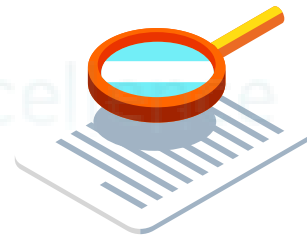
Structurer son rapport d'audit

Mots-Clés : Audit de processus, fournisseurs, référentiel, communication, questionnement, synergologie, guide d'audit, rapport d'audit, amélioration continue, ISO 9000.