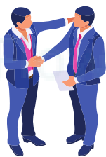
Mettre en confiance

Emergence signé par 1/2 journée. Exercices autonomes réguliers pour s'assurer de l'assimilation, Evaluation des acquis de l'apprenant en fin de formation.